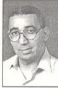
محمد صلاح الدين

السينما المصرية حين تتناول الدين والعقيدة في أفلامها فإنها لا شك تعرف طريقها اليسير نحو مشاعر جماهيرها.. وتعرف أنها تخاطب وجدانه بأقصر الطرق وأوضحها وأجلها، مما يضمن لها النجاح والوصول إلى أكبر عدد ممكن من المشاهدين لهذا الفن.. ومع ذلك لم تستثمر السينما المصرية هذا