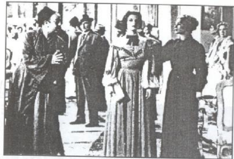
لقطة من فيلم (شفيقة القبطية)