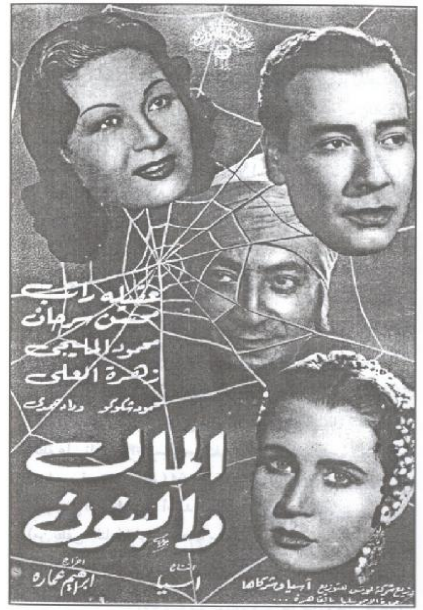
ملصق فيلم (المال والبنون)