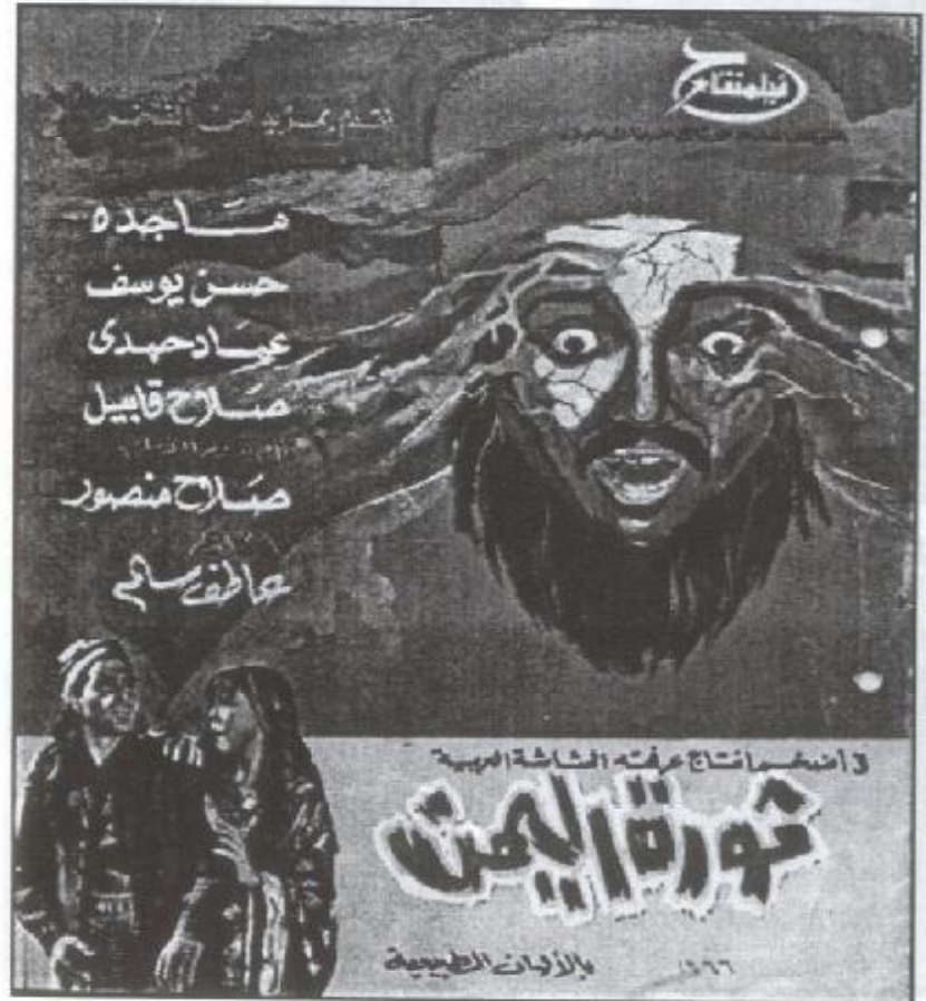
ملصق من فيلم (ثورة اليمن)

صورة من قرار الرئيس محمد نجيب بمنع فيلم (ليلة القدر)