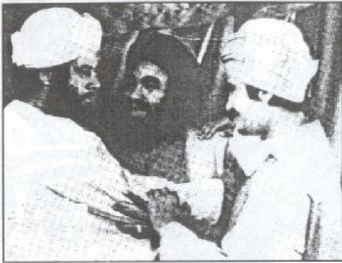
لقطة من فيلم (فجر الإسلام)