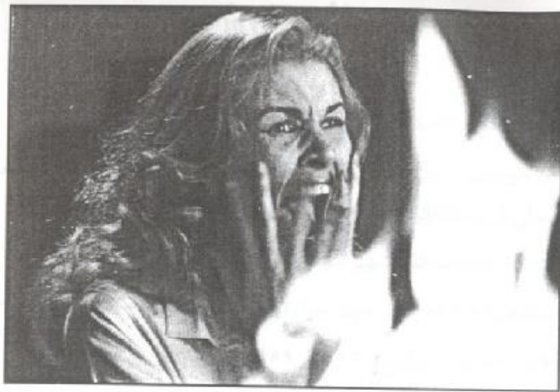
لقطة من فيلم (الإنس والجن)