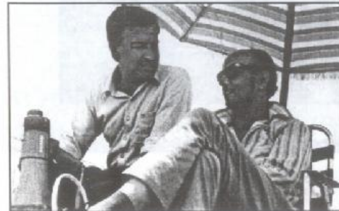
لقطة نادرة : مصطفى العقاد معاوناً في فيلم (الشيماء)