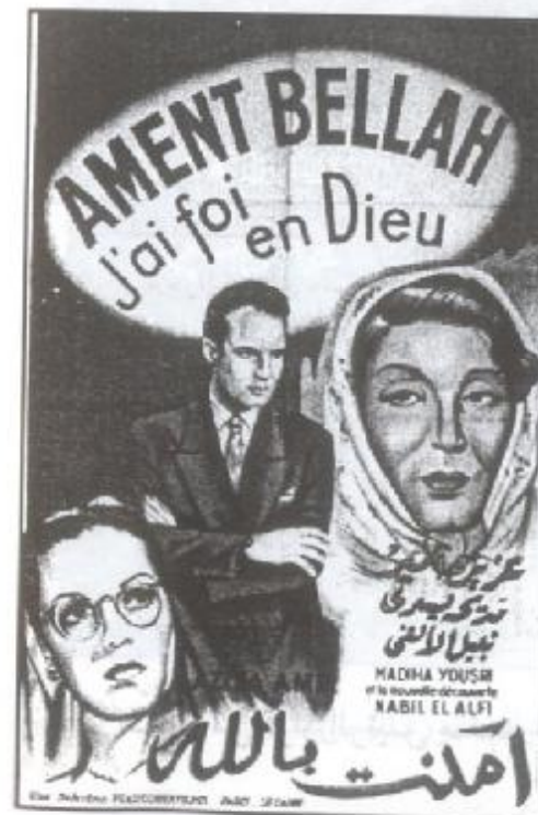
ملصق فيلم (آمنت بالله)