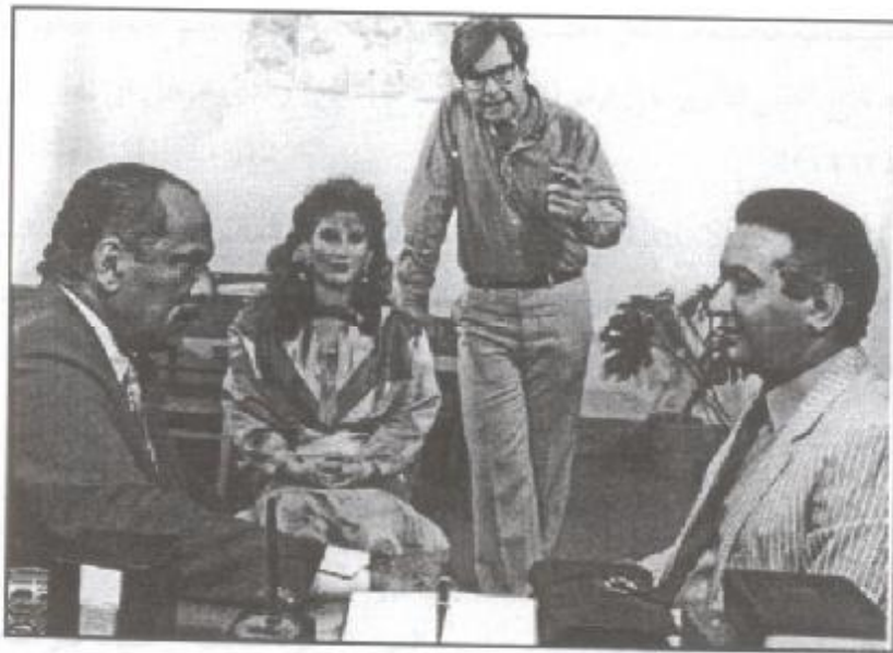
لقطة من فيلم (جرى الوحوش)