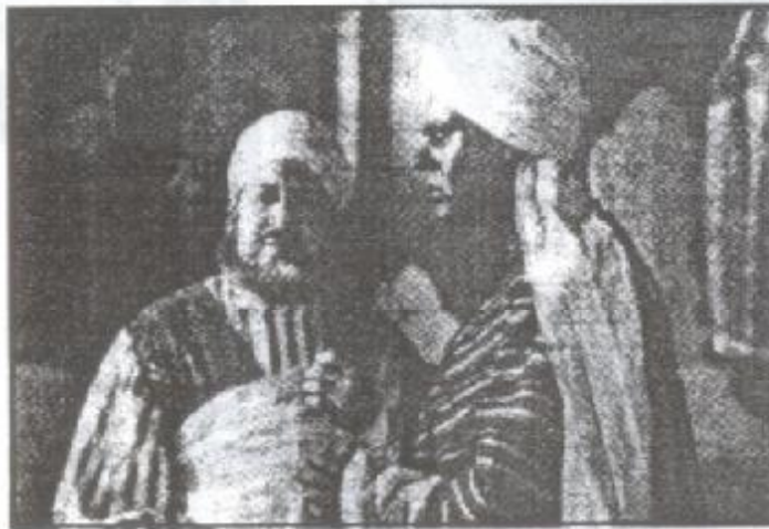
لقطة من فيلم (بلال مؤذن الرسول)