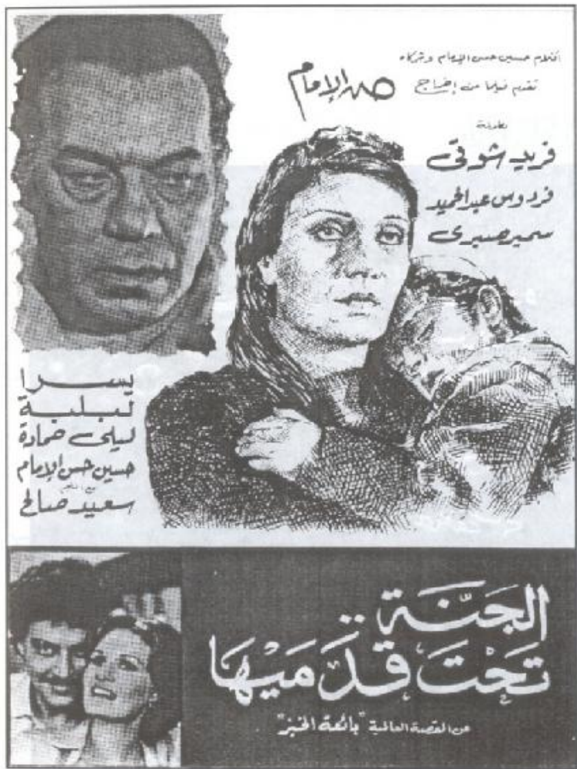
ملصق فيلم (الجنة تحت قدميها)