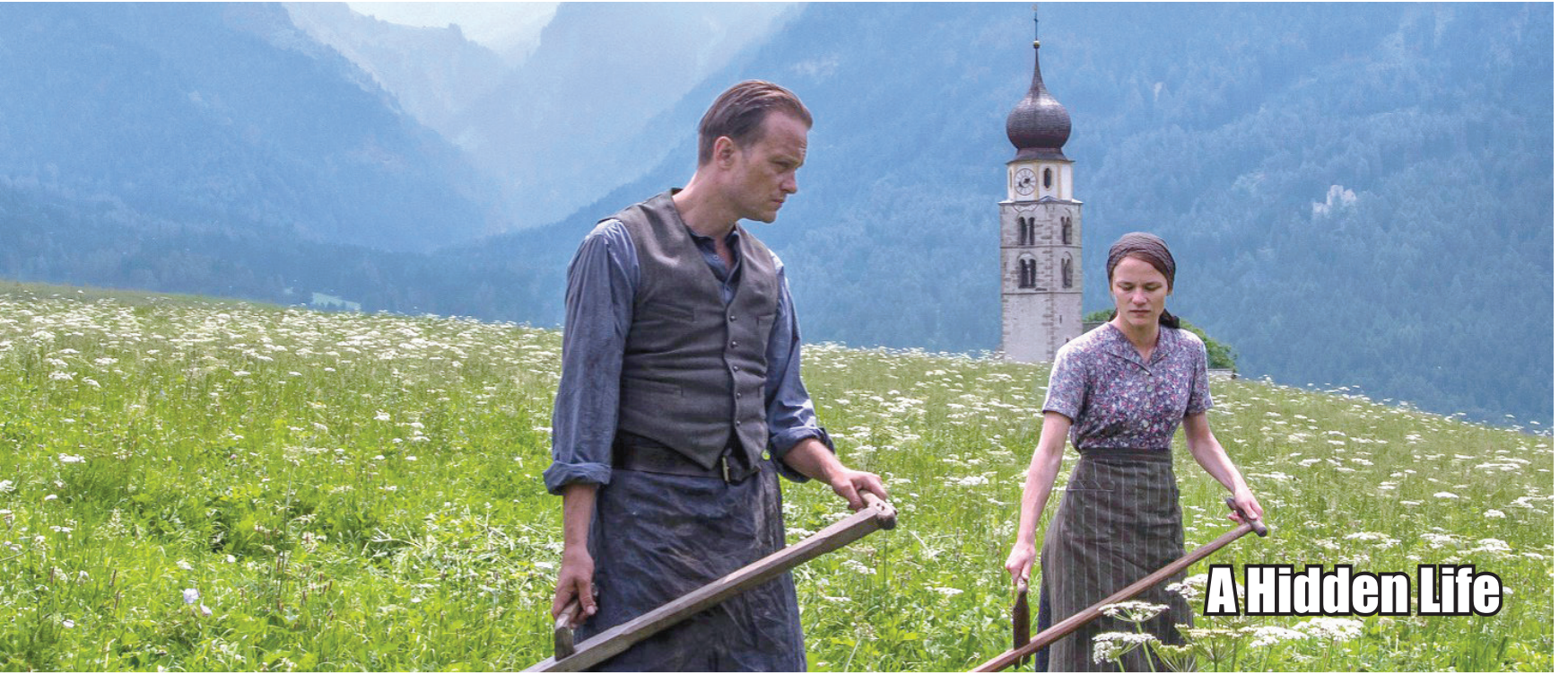
A Hidden Life