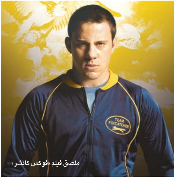
ملصق فيلم «فوكس كاتشز»

يذكر أن فيلم «بيردمان» تصدر قائمة أكثر الأفلام ترشحاً لجوائز الأوسكار ضمن ٩ فئات، فيما ترشح فيلم «لعبة التقليد» لثمانية فئات ضمن جوائز الأوسكار، أما فيلم «نظريه كل شيء» فحصل على ٥ ترشيحات لجوائز الأوسكار، وحصل فيلم «فوكس كاتشز» على ٥ ترشيحات، فيما حصلت الممثلة ريس ويندسون على ترشيح لجائزة أوسكار أفضل ممثلة عن دورها في فيلم «برزي»، للمخرج جين مارك فاييه، إلى جانب النجمة لورا ديرن التي ضمنت موقعا لها ضمن منافسات جائزة أفضل ممثلة في دور مساعد.