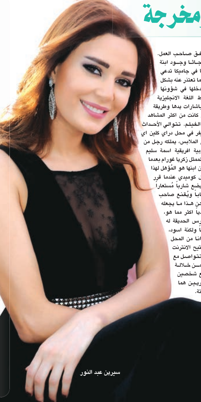
سيرين عبد النور

كشفت الممثلة سيرين عبد النور أخيراً عبر مواقع التواصل الاجتماعي، عن مجموعة من الصور الجديدة للفيلم «سوء فاقهم» الذي تشارك في بطولته، والمقرر أن يعرض في دور السينما خلال الشهر المقبل، ويشارك في الفيلم كل من الممثل شريف سلامة لسيرين في المنص بعد تجربتها الأولى التي قدمتها منذ ٦ سنوات مع الممثل محمد هنيدي في فيلم «رمضان مبروك أبو العليين حمودة»، وفي تعليق لها على الفيلم قالت سيرين «إنه بعد تجربة مختلفة تماماً عن الوجود حالياً، كونه يبحث دائما عن الشيء المختلف، مشيرة إلى أنها تجسد فيه شخصية فتاة لبنانية تدعى ليانا، وتعمل بائعة حلوى.